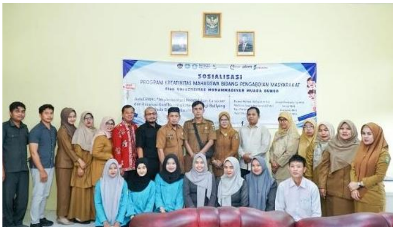
Gambar 4. Sosialisasi Terhadap Guru Tentang Bullying

Kegiatan sosialisasi kepada guru juga memberikan dampak positif. Guru menjadi lebih memahami konsep bullying, strategi penguatan karakter, serta teknik penyelesaian konflik secara damai. Guru mulai mengintegrasikan nilai-nilai karakter ke dalam proses pembelajaran dan berperan aktif dalam menciptakan lingkungan sekolah yang positif.