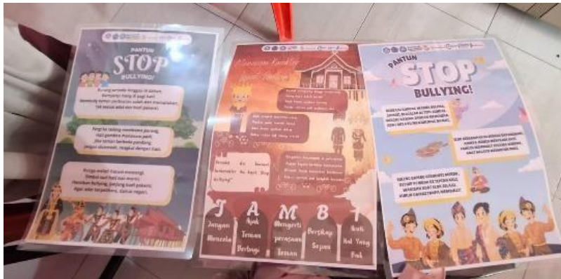
Gambar 6. Pemberian Poster Kepada Sekolah