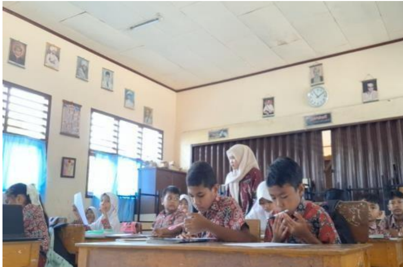
Gambar 3. Pelaksanaan Post-Test

saat pre-test menjadi 85% pada saat post-test. Dengan demikian, terjadi peningkatan sebesar 27%, yang menunjukkan bahwa target peningkatan pemahaman siswa telah tercapai.