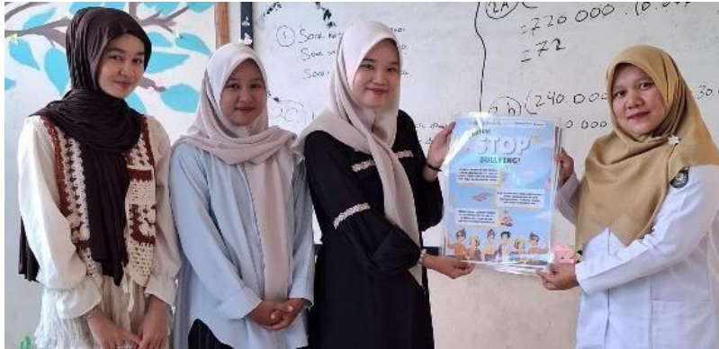
Gambar 5. Pemberian Poster Kepada Sekolah

Sebagai bentuk keberlanjutan program, dibentuk Tim Pencegahan dan Penanganan Kekerasan di sekolah yang bertugas melakukan pendampingan, mediasi konflik, serta kampanye anti-bullying secara berkelanjutan berupa poster seperti pada gambar di bawah ini yang memiliki spesifikasi produk pada tabel 1.