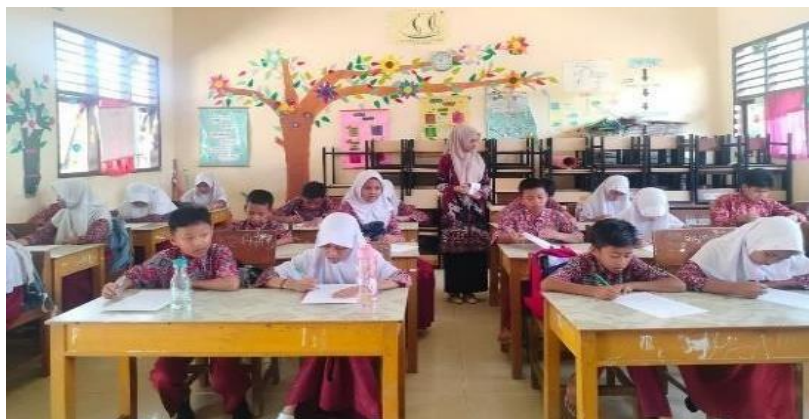
Gambar 2. Pelaksanaan Pre-Test

Hasil pre-test menunjukkan bahwa sebagian besar siswa belum memahami konsep bullying secara komprehensif. Sebagian siswa masih menganggap ejekan, pengucilan, dan tindakan fisik ringan sebagai perilaku yang wajar. Kondisi tersebut menunjukkan rendahnya pemahaman siswa mengenai bentuk dan dampak bullying.