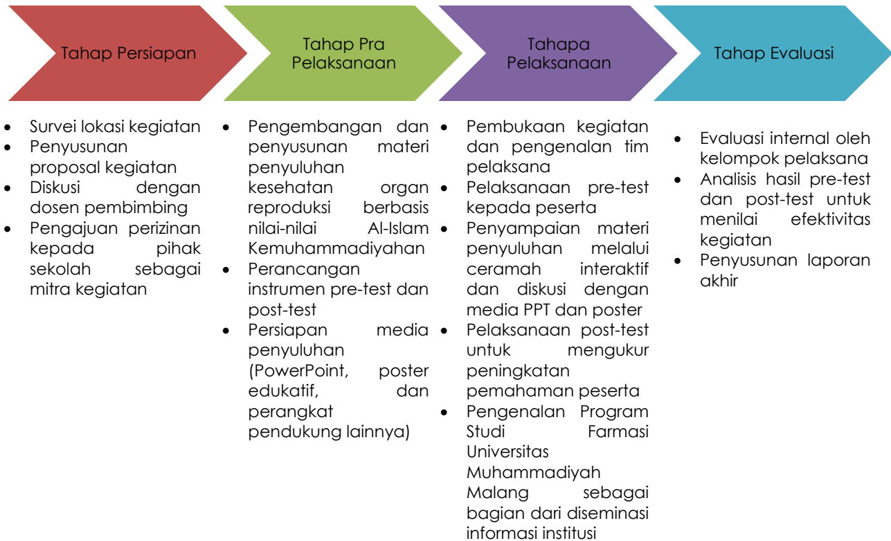
Gambar 1. Bagan Alur Pelaksanaan Kegiatan Pengabdian