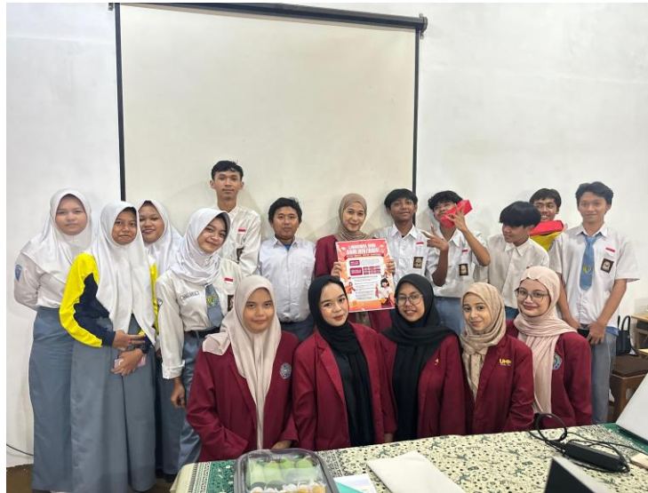
Gambar 3. Foto Bersama

Peningkatan pengetahuan yang signifikan setelah pelaksanaan edukasi juga menunjukkan bahwa kegiatan ini berpotensi memberikan dampak jangka panjang berupa perubahan perilaku yang lebih sehat. Menurut WHO (2022), peningkatan pengetahuan remaja mengenai kesehatan reproduksi merupakan salah satu strategi preventif yang efektif dalam menurunkan risiko perilaku seksual berisiko, infeksi menular seksual, serta kehamilan tidak diinginkan. Pengetahuan yang memadai memungkinkan remaja untuk lebih memahami konsekuensi dari setiap perilaku yang dilakukan, sehingga mendorong mereka untuk mengambil keputusan yang bertanggung jawab terhadap kesehatan diri dan masa depannya.